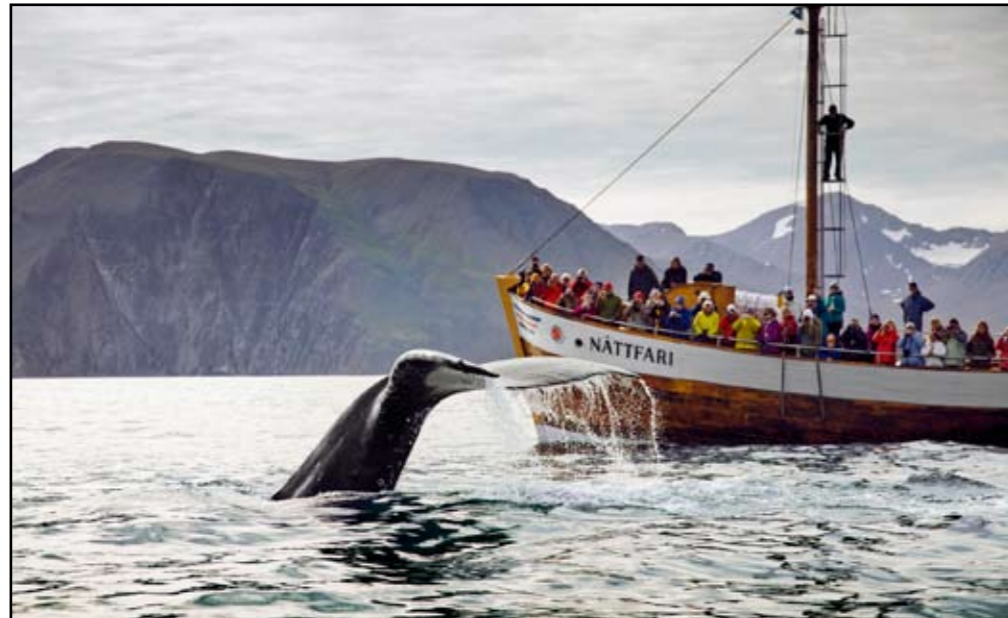
Fyrstu hvalaskoðunarferðirnar hófust árið 1995 og urðu fljótlega vinsælar. Boðið er upp á styttri og lengri siglingar.

Íslensku ALPARNIR HREYFING • KRAFTUR • ÁNÆGJA