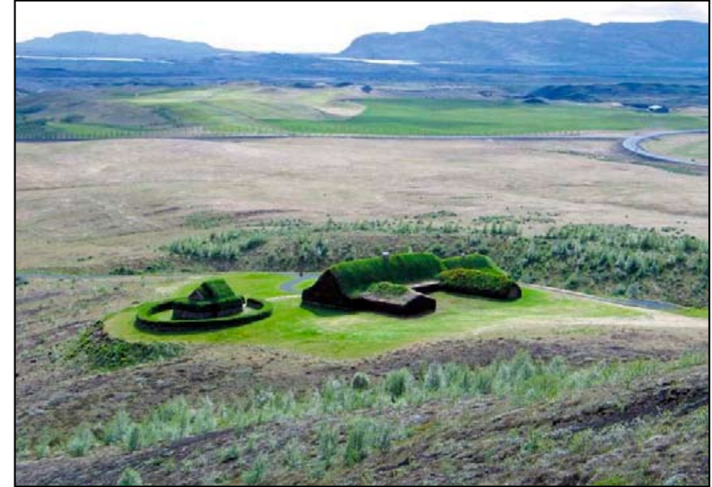
Þjóðveldisbærinn Stöng.

Þjóðveldisbænum var valinn staður í grennd við rústir Skeljastaða og skiptist hann í skála, stofu, búr, anddyri, klefa og kamar. Skálinn var aðalhúsið