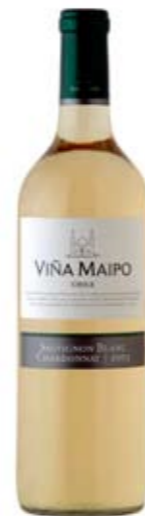
Vina Maipo Sauvignon Blanc / Chardonnay er hið fullkomna sumarvín og passar vel með sjáfarfangi og léttum grænmetisréttum.