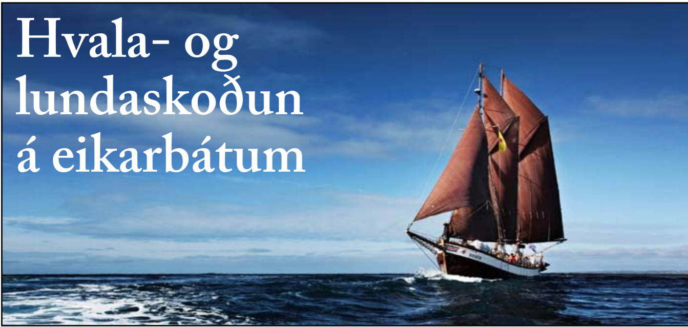
Skonnortan Haukur. Norðursigling bætir fljótlega við skonnortunni Hildi en hún er væntanleg frá Danmörku á næstunni.