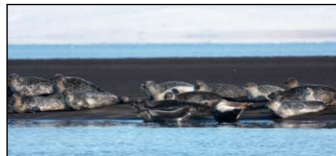
Sellátur á Vatnsnesi eru talin ein bestu selaskoðunarsvæði í Norðrú Evrópu (Pétur Jónsson).